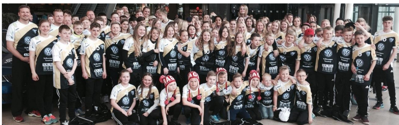
Vindertrøjen fra 2015